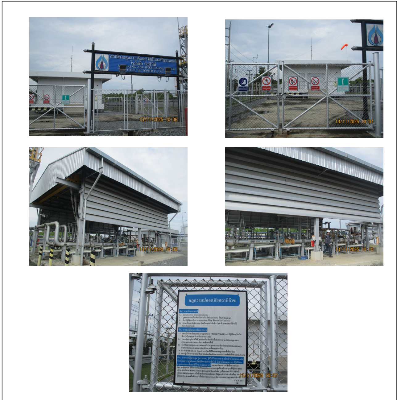
รูปที่ 1.3.1-2 สภาพทั่วไปของสถานีควบคุมความดันและปริมาณก๊าซธรรมชาติ